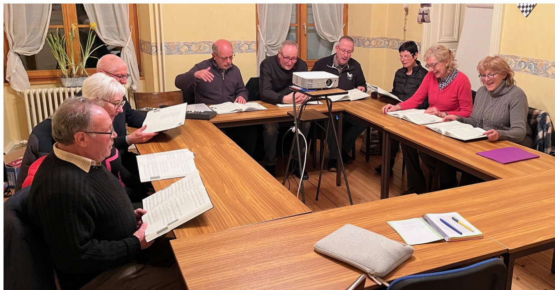
Les chorales à la découverte du nouveau Psautier le 25 février